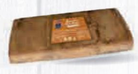
CAMPOFRÍO BACON SIN PIEL Y SIN LACTOSA PIEZA 4 KG. APROX. Cod: 2711