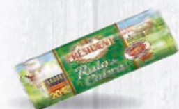
PRESIDENT RULO DE CABRA SAINT MAURE PIEZA 180 GRS. C/6 UDS. Cod: 2824