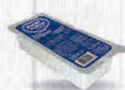
BURGO DE ARIAS QUESO FRESCO CON SAL BRICK 1,5 KG. Cod: 2498 El Kilo sale a 4,66€