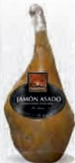
NAVIDUL LACÓN ASADO Y AHUMADO 8 KG. APROX. Cod: 1738