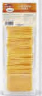
CAMPOFRÍO QUESO CHEDDAR ROJO BANDEJA 1 KG. (50 L.) ESPECIAL HAMBURGUESAS Cod: 2429