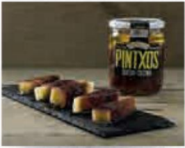
MONTE NUEVO PINTXOS QUESO CECINA TARRO 8 UDS. 400 GR. Cod: 2134