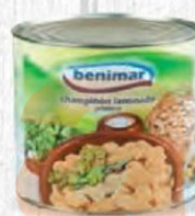
BENIMAR CHAMPIÑÓN LAMINADO LATA 3 KG. Cod: 1768