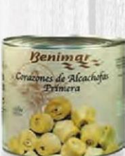
BENIMAR CORAZONES DE ALCACHOFA 1º 30/40 LATA 3 KG. Cod: 1767