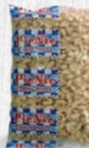
PICNIC CACAHUETE REPELADO FRITO Bolsa 1 kg. Cod: 1848