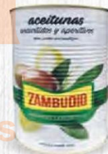
ZAMBUDIO PIPARRAS Lata 2 kg. Cod: 2409