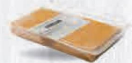
RENY PICOT QUESO LONCHAS CHEDDAR COLOR 500 GR. APROX. Cod: 2083