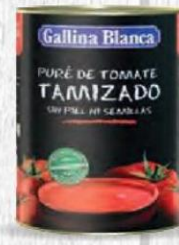
GALLINA BLANCA TOMATE TAMIZADO Lata 4 kg Caja 3 uds Cod: 1109