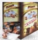
GIMAR MINI MAGDALENA RELLENA CHOCOLATE Caja 1,5 kg. Cod: 2640