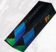
ROLLO ALUMINIO 13 micras 30 cm Cod: 528