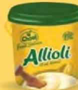
ALLIOLI Cubo 2 kg. Cod: 206