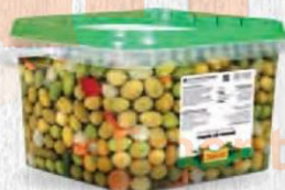
ZAMBUDIO ACEITUNAS COCKTAIL Bote 4,5 kg. Cod: 613