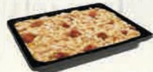
ALUBIAS CON CHORIZO 1,8 KG. Cod: 2528