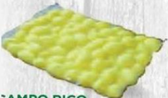
CAMPO RICO SOLSA PATATA ENTERA PEQUEÑA 1,5 kg. Cod: 2392