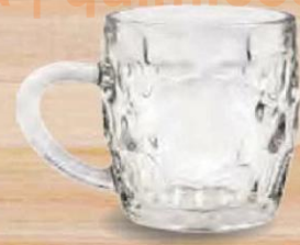
SINTRA JARRA CERVEZA 29 cl. - P/12 uds. Cod: 2612