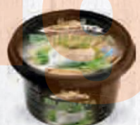
TOSCANELLA QUESO BURRATA 150 GR. Cod: 2525