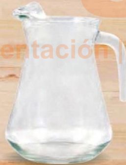
JARRA VIDRIO SANGRIA 1300 cc. - P/6 uds. Cod: 2613