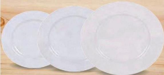
FELIT PLATO LLANO 21 cm. - P/6 uds. Cod: 2595