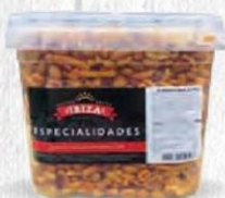
FRUTOS SECOS IBIZA COCKTAIL CHILLY PICANTE Cubo 1,6 kg. Cod: 1147