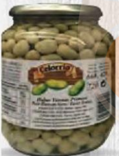
CELORRIO TARRO DE HABAS 1º P.E 720 ml. Caja 12 uds Cod: 2164