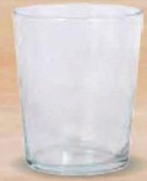
BODEGA VASO SIDRA 50 cl. - P/12 uds. Cod: 2606