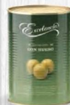
EXCELENCIA ACEITUNAS MANZANILLA SABOR A ANCHOA 160/280 Lata 2,5 kg. Cod: 2386