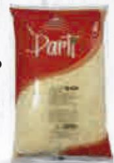
FORVAL QUESO MOZZARELLA PARTÍ 50 GRANO 2 KG. Cod: 1436