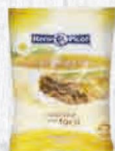
RENY PICOT QUESO RALLADO EMMENTAL BOLSA 1 KG. Cod: 2204