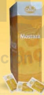
MOSTAZA Monodos 6 gr. Estuche 378 uds. Cod: 1479