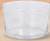
BODEGA VASO CHIQUITO 23 cl. - P/12 uds. Cod: 2611