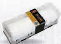
NAVIDUL QUESO DE RULO DE MEZCLA CABRA/VACA PIEZA 1 KG. Cod: 2445