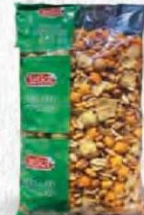
LEIKA COCKTAIL PICOTERO Bolsa 1 kg. Cod: 2698