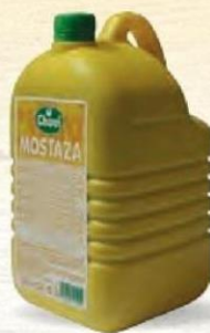
MOSTAZA Bot. 1,9 kg. Cod: 808