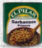
EL PILAR GARBANZO ROJA 1º Lata 3 kg Caja 6 uds Cod: 2554