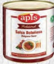
APIS SALSA BOLOÑESA Bote 2,5 kg. Cod: 2728