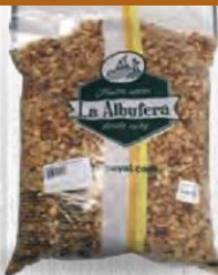
LA ALBUFERA COCKTAIL FRUTOS SECOS Bolsa 5 kg. Cod: 1425