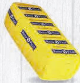
RENY PICOT QUESO BARRA FUNDIDO EDAM 3 KG. APROX. Cod: 1846