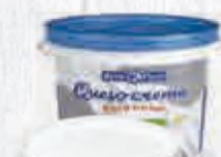
RENY PICOT QUESO DE UNTAR CUBO 2 KG. Cod: 2168 El Kilo sale a 4,495€