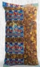
PICNIC COCKTAIL FAMILIAR Bolsa 1 kg. Cod: 1849