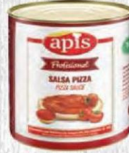
APIS SALSA PIZZA Bote 2,5 kg. Cod: 2723