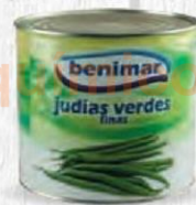
BENIMAR JUDÍAS VERDES P.E. 1650 GR. Cod: 2562