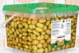
ZAMBUDIO ACEITUNAS PARTIDAS CHUPADEO Bote 4,5 kg. Cod: 2642