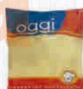
OGGI QUESO RALLADO HILO GRATINAR BOLSA 1,5 KG. Cod: 2486