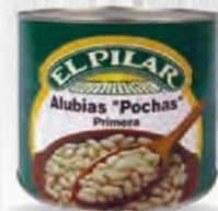
EL PILAR ALUBIA POCHA BLANCA Lata 3 kg Caja 6 uds Cod: 2555