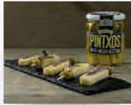
MONTE NUEVO PINTXO QUESO OVEJA, ANCHOA Y ACEITUNA TARRO 8 UDS. 400 GR. Cod: 2481