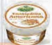
CHOVÍ ENSALADILLA AMERICANA BOTE 1 KG. Cod: 1775