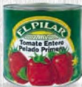
EL PILAR TOMATE ENTERO PELADO 1º CAJA 6 UDS. LATA 3 KG. Cod: 345