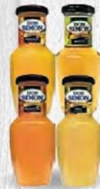
DON SIMÓN 200 ml. Cristal 24 bot. NÉCTAR NARANJA Cod: 1373 NÉCTAR PIÑA Cod: 1374 NÉCTAR MELOCOTÓN Cod: 13 NÉCTAR MANZANA Cod: 2521 NÉCTAR MOSTO Cod: 1953