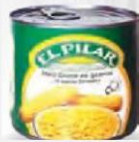
EL PILAR MAÍZ DULCE EN GRANOS ABREFÁCIL CAJA 12 UDS. LATA 1/2 KG. Cod: 188