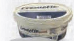
CREMETTE QUESO CREMA 3,5 KG. C/ 2 UDS. Cod: 1437 El Kilo sale a 5,45€