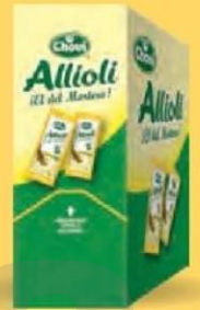
ALLIOLI Monodos 20 ml. Estuche 140 uds. Cod: 1101