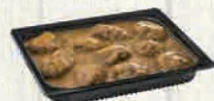
CARRILLERA EN SALSA 1,9 KG. Cod: 2671