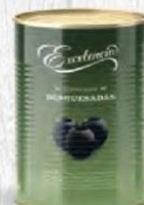
EXCELENCIA ACEITUNAS NEGRAS SIN HUESO Lata 2 kg. Cod: 2141