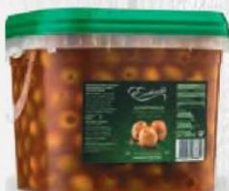
EXCELENCIA ACEITUNAS GIGANTE MOJO PICÓN SIN HUESO Cubo 2 kg. Cod: 2240