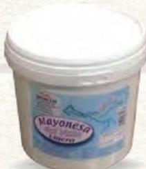
MAYONESA LIGERA Cubo 3,6 kg. Cod: 1545