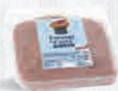
CAMPOFRÍO FIAMBRE DE MAGRO LONCHAS BANDEJA 1 KG. (42 LONCHAS) Cod: 1851