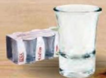
SENA VASO CHUPITO 37,5 cl. - P/6 uds. Cod: 2638