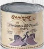
BENIMAR PIMIENTO DEL PIQUILLO ENTERO LATA 3 KG. Cod: 828