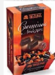
BOMBONES CREMINOS Dispensador 800 Gr Cod: 1810 NOIR Cod: 1873 SABORES