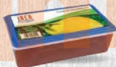
IBER CARNE DE MEMBRILLO Bloque 4 kg. Cod: 2209