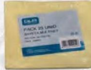
BAYETA ANTIBACTERIAS MULTINET Pack 25 uds. Cod: 2454