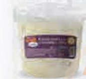
CAMPOFRÍO ENSALADILLA CANGREJO Y PIÑA BOTE 1 KG. Cod: 1692