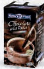
RENY PICOT CHOCOLATE A LA TAZA BRICK 1 L. Cod: 1999