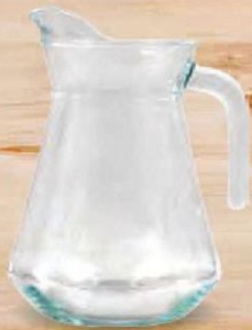
BORGO JARRA VIDRIO 1000 cc. - P/6 uds. Cod: 2614