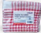
PAÑO DE COCINA SAGRA Pack 12 uds. Cod: 2455