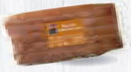
OSCAR MAYER BACON AMERICANO O COSTILLAR PIEZA 4,3 KG. APROX. Cod: 1020