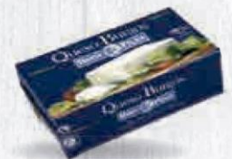
RENY PICOT QUESO BURGOS BRICK 1 KG. Cod: 2447