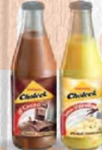
CHOLECK 20 cc. Cristal 12 bot. No Ret. VAINILLA Cod: 1610 CHOCOLATE Cod: 767