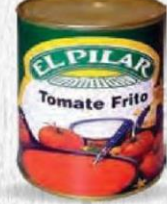
EL PILAR TOMATE FRITO Lata 2'6 kg Caja 6 uds Cod: 347