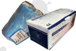
MASCARILLA FILTRANTE FFP2 Estuche 50 und Cod: 2742