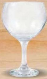
MISKET COPA COMBINADOS 645 cc. - P/6 uds. Cod: 2618