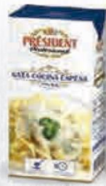
PRESIDENT NATA PARA COCINAR 18% MG BRICK 1 L. Cod: 943