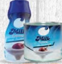
MILK FACTORY LECHE CONDENSADA Sirve fácil 900 gr. Cod: 2347 Lata 1 kg. Cod: 1858