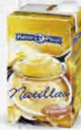
RENY PICOT NATILLAS VAINILLA BRICK 1 L. Cod: 1970