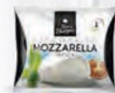
FORVAL MOZZARELLA ERECA BOCCONCIN CIN 125 GR. Cod: 2722