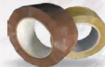
PRECINTO ACRÍLICO Caja 36 uds. Transparente Cod: 1982 Marrón Cod: 1983