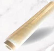
FILM DE PALETIZAR MANUAL 2,4 kg 23 micras Cod: 1647