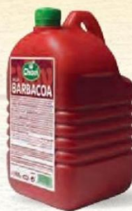
SALSA BARBACOA Bot. 1,9 kg. Cod: 877