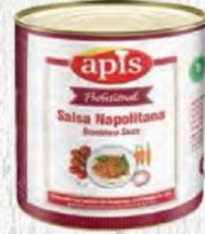
APIS SALSA NAPOLITANA Bote 2,5 kg. Cod: 2727