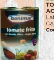
BENIMAR TOMATE FRITO ACEITE DE OLIVA Lata 1/2 kg. Caja 12 uds Cod: 2572