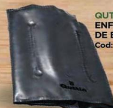
GUTTIN ENFRIADOR DE BOTELLAS Cod: 2641