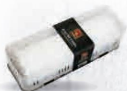
NAVIDUL QUESO DE RULO DE CABRA 100% LECHE CRUDA PIEZA 1 KG. Cod: 2105