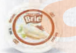
RENY PICOT QUESO BRIE Corte pequeño Cod: 2117