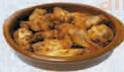
ALITAS DE POLLO ADOBADAS 400 GR. Cod: 2492