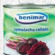
BENIMAR REMOLACHA RALLADA 3 KG. CAJA 3 UDS. Cod: 1843