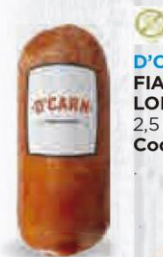
D'CARN FIAMBRE DE LOMO ADOBADO 2,5 KG. APROX. Cod: 2709