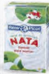
RENY PICOT NATA PARA MONTAR 1000 CC. Cod: 1794