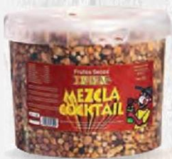
FRUTOS SECOS IBIZA COCKTAIL Cubo 5 kg. Cod: 901