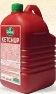
KETCHUP Bot. 1,9 kg. Cod: 205