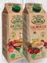
DON SIMÓN GAZPACHO O SALMOREJO 1 L. Cod: 2733 SALMOREJO Cod: 1477 GAZPACHO