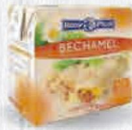
RENY PICOT BECHAMEL 500 CC. Cod: 2200