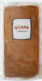
D'CARN BACON SIN PIEL PIEZA 3 KG. APROX. Cod: 2707