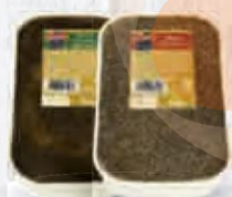
CAMPOFRÍO PATÉ PIMIENTA Y FINAS HIERBAS BANDEJA 2 KG COD: 2328 (Pimienta) COD: 2329 (Finas Hierbas)