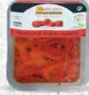
CAMPO RICO PIMIENTOS ROJOS ASADOS TROCEADO Bandeja 1 kg. Cod: 1904