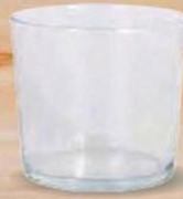
BODEGA VASO PINTA 36 cl. - P/12 uds. Cod: 2610