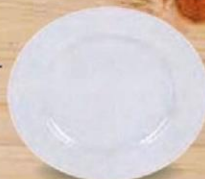
FELIT PLATO POSTRE 19 cm. - P/6 uds. Cod: 2597