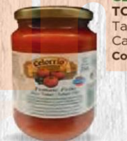
CELORRIO TOMATE FRITO Tarro 370 ml Caja 12 uds Cod: 2565