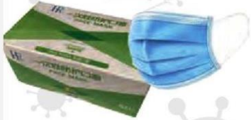
MASCARILLA QUIRÚRGICA DESECHABLE Estuche 50 und Cod: 2741