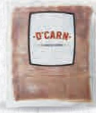
D'CARN BACON LONCHAS 2 KG. Cod: 2658