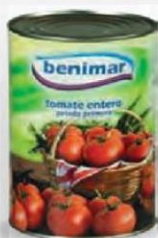
BENIMAR TOMATE ENTERO CAJA 3 UDS. LATA 5 KG. Cod: 2563