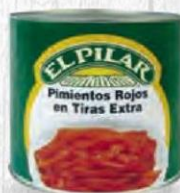
EL PILAR PIMIENTOS ROJOS TIRAS EXTRA CAJA 6 UDS. Lata 3 kg. Cod: 350