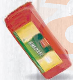
BREDAM QUESO BARRA EDAM 3 KG. APROX. Cod: 924