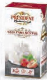
PRESIDENT NATA PARA MONTAR 35% MG BRICK 1 L. Cod: 1040