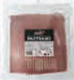
D'CARN PASTRAMY DE TERNERA LONCHAS BANDEJA 1 KG. - C/ 4 UDS. Cod: 2837