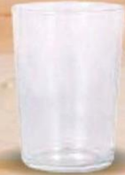
ALANDALUS VASO VIDRIO 28 cl. - P/24 uds. Cod: 2607