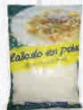
RENY PICOT QUESO RALLADO EN POLVO BOLSA 1 KG. Cod: 1788