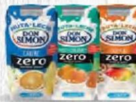
DON SIMÓN BIO 33 cl. - 21 bricks Cod: 1734 CARIBE Cod: 1737 MEDITERRÁNEO Cod: 1736 TROPICAL