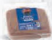
CAMPOFRÍO JAMÓN COCIDO LONCHAS BANDEJA 1 KG. (42 LONCHAS) Cod: 1852