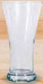
SORGUN VASO CERVEZA 380 cc. - P/24 uds. Cod: 2609