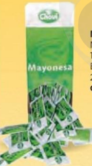
MAYONESA Monodos 12 gr. Estuche 252 uds. Cod: 1481