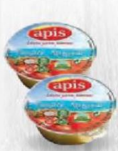
APIS TOMATE TARRINA Tarrina 23 Gr. C/45 und Cod: 2767