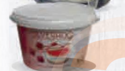
SILVERADO QUESO ESPECIAL TARTAS CUBO 2 KG. Cod: 1648 El Kilo sale a 3,945€