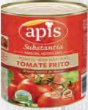
APIS TOMATE FRITO 100% NATURAL Bote 2,5 kg. Cod: 2724