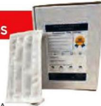
MASCARILLA HIGIÉNICA REUTILIZABLE Estuche 10 und Cod: 2743