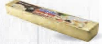
QUESO SLICING BRIE 500 GR. Cod: 1722