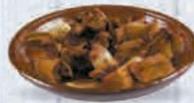
MORRO DE CERDO COCIDO 1,5 KG. APROX. AL VACIO Cod: 1936