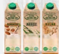
DON SIMÓN BEBIDAS VEGETALES 1 L. Caja 6 uds. AVENA Cod: 2677 ARROZ Cod: 2678 ALMENDRA Cod: 2679