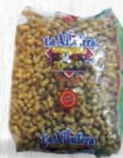
LA ALBUFERA CACAHUETE CÁSCARA TOSTADO Bolsa 3 kg. Cod: 611