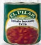
EL PILAR TOMATE TROCEADO CAJA 12 UDS. LATA 1 KG. Cod: 2560