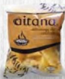
AITANA PAPAS CALDERA Bolsa 45 gr. Caja 20 uds. Cod: 315