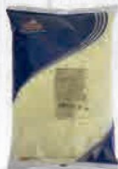
FORVAL QUESO MOZZARELLA PURA ESPECIAL GRANO ITALIANO 2 KG. Cod: 1458