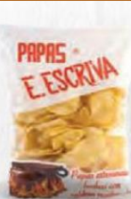
ESCRIVA PAPAS CALDERA Bolsa 450 gr. Caja 8 uds. Cod: 864