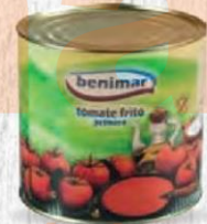
BENIMAR TOMATE FRITO Lata 3 kg. Caja 3 uds Cod: 2571