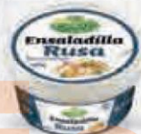
CHOVÍ ENSALADILLA RUSA BOTE 1 KG Cod: 1777