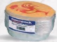
BANDEJA PARA POLLO OVALADA CON TAPA Pack 50 uds. Cod: 856