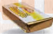
CAMPOFRÍO QUESO BRIE Pieza 1,5 Kg ESPECIAL LONCHEADO HOSTELERÍA Cod: 2848