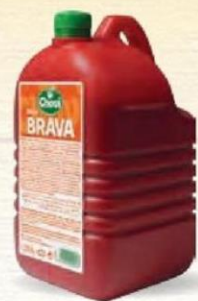
SALSA BRAVA Bot. 1,9 kg. Cod: 878