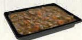
TERNERA ISLEÑA 2 KG. Cod: 2518