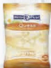
RENY PICOT QUESO RALLADO HILO BOLSA 1 KG. Cod: 2203