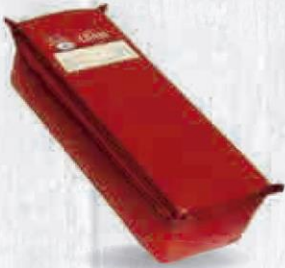
CAMPOFRÍO QUESO EDAM 40% MG/ES BARRA 3 KG. ESPECIAL PARA FUNDIR Y COMER FRÍO Cod: 2434