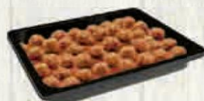
ALBONDIGAS CON TOMATE 2 KG. Cod: 1862