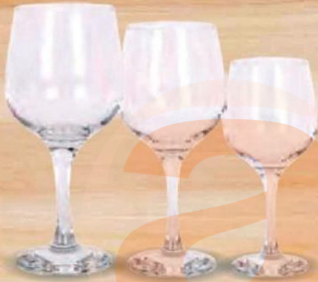
FINCA COPA VINO/AGUA 480 cc. - P/24 uds. Cod: 2619