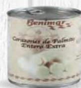
BENIMAR PALMITO ENTERO LATA 1 KG. Cod: 1969