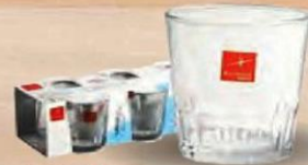
SABOYA VASO CARAJILLO 110 cl. - P/6 uds. Cod: 2637