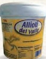
ALLIOLI Bote 2 kg. Cod: 603