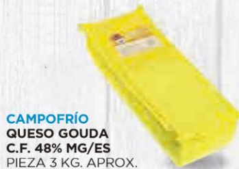
CAMPOFRÍO QUESO GOUDA C.F. 48% MG/ES PIEZA 3 KG. APROX. Cod: 924