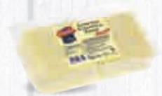
CAMPOFRÍO QUESO EDAM LONCHAS PARA FUNDIR Ó COMER BANDEJA 1 KG. (48 LONCHAS) Cod: 2035