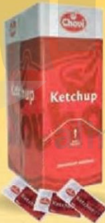
KETCHUP Monodos 12 gr. Estuche 252 uds. Cod: 1480