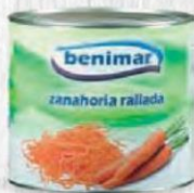
BENIMAR ZANAHORIA RALLADA LATA 3 KG. CAJA 3 UDS. Cod: 2326