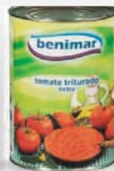
BENIMAR TOMATE TRITURADO LATA 4,2 KG. Cod: 2570