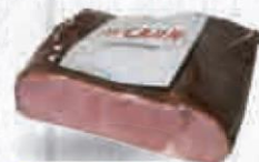
D'CARN PASTRAMY DE TERNERA 2,2 KG. APROX. Cod: 2697