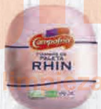
CAMPOFRÍO PALETA RHIN 5 KG. APROX. Cod: 2037