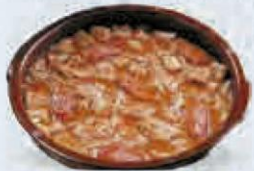
CALLOS DE TERNERA CASEROS 2,5 KG APROX. Cod: 1944