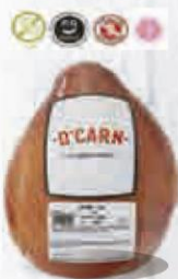
D'CARN LACÓN AHUMADO NATURAL Sin lactosa 6 KG. APROX. Cod: 2657