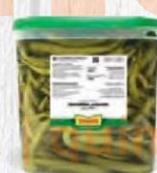
ZAMBUDIO GUINDILLAS PICANTES Bote 1,5 kg. Cod: 1915