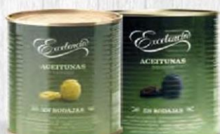
EXCELENCIA ACEITUNAS VERDES Y NEGRAS EN RODAJAS Lata 1560 Gr. Cod: 2142 (VERDES) Cod: 2143 (NEGRA)