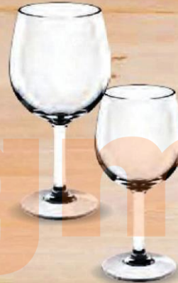
FINCA COPA VINO 52 cl. - P/6 uds. Cod: 2616