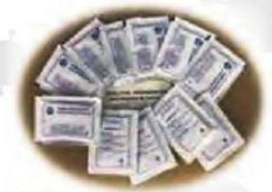
TOALLITA HIGIENIZANTE DESINFESTAN- TE - C/ 500 und Cod: 2747