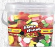
FRUTOS SECOS IBIZA GOMINOLAS MEZCLA PARTY Cubo 2 kg. Cod: 1148