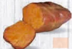
SOBRASADA IBÉRICA SUAVE PIEZA 1,5 KG. APROX. Cod: 1091