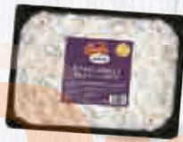
CAMPOFRÍO ENSALADILLA RUSA BANDEJA 2 KG. Cod: 1186 9,50 €/bandeja 2 kg.