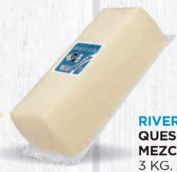
RIVERA DEL TAJO QUESO BARRA MEZCLA SEMI 3 KG. APROX. Cod: 2551