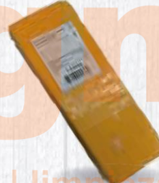
RENY PICOT QUESO BARRA CHEDDAR COLOR 2,5 KG. APROX. Cod: 2082