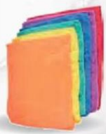
PLA BAYETA Microfibra Pack 12 uds. Cod: 2302