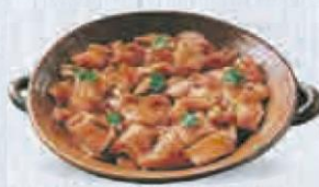
OREJA DE CERDO EN ADOBO 1,5 KG. APROX. AL VACIO Cod: 1935