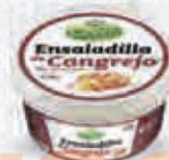
CHOVÍ ENSALADILLA DE CANGREJO BOTE 1 KG. Cod: 1774