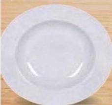
FELIT PLATO HONDO 22,5 cm. - P/6 uds. Cod: 2596