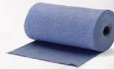
ROLLO TELA PLANCHA 3 kg. Cod: 1328