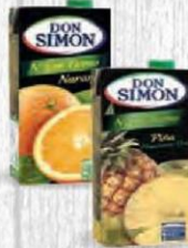
DON SIMÓN ZUMO NARANJA 1 L. 12 bricks Cod: 1356 ZUMO PIÑA 1 L. 12 bricks Cod: 1357 ZUMO MANZANA 1 L. 12 bricks Cod: 2049