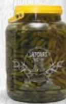
LA TORRE PEPINILLOS EXTRA Bote 2,3 kg. Cod: 2410