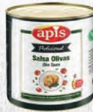
APIS SALSA OLIVAS Bote 2,5 kg. Cod: 2725