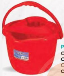
PLA CUBO REDONDO CON ESCURREDERO Capacidad 14 L. Cod: 1446