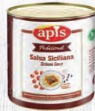
APIS SALSA SICILIANA Bote 2,5 kg. Cod: 2726