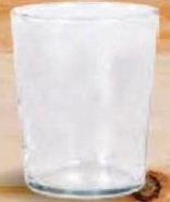
ALANDALUS VASO VIDRIO 24 cl. - P/24 uds. Cod: 2608