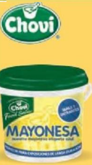
MAYONESA ETIQUETA AZUL Cubo 3,6 kg. Cod: 212