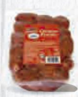
CAMPOFRÍO CHORIZO APERITIVO OREADO BANDEJA 1 KG. Cod: 2255