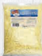
CAMPOFRÍO QUESO RALLADO EMMENTAL BOLSA 1 KG. Cod: 2430