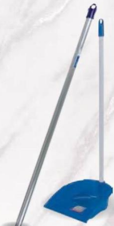
PLA PALO TITANIO 140 cm Cod: 1684