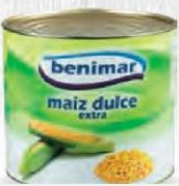
BENIMAR MAÍZ DULCE LATA 1870 GR CAJA 3 UDS. Cod: 1299