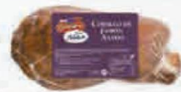
CAMPOFRÍO CODILLO ASADO PIEZA 300 GR. APROX. CAJA 8 CODILLOS Cod: 2263