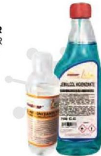
JEMAQUIMP GEL HIGIENIZANTE 150 ml Caja 12 und Cod: 2744