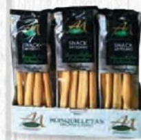
AIMA ROSQUILLETAS ARTESANALES Paquete 55 gr. Caja 30 uds. Cod: 1504