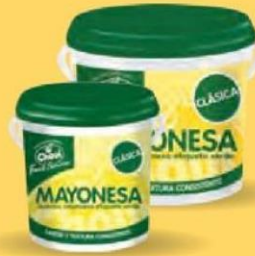
MAYONESA ETIQUETA VERDE Cubo 3,6 kg. Cod: 204 Cubo 2 kg. Cod: 203