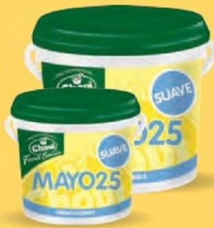
MAYO 25 SUAVE Cubo 10 kg. Cod: 1730 Cubo 3,6 kg. Cod: 1729