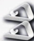
PINZAS SUJETAMANTELES Bolsa 100 und Cod: 1659