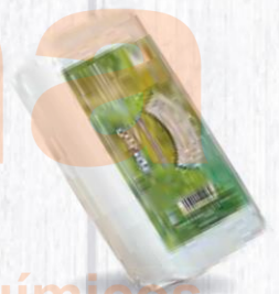
MONQUES QUESO BARRA MEZCLA TIERNO 3,2 KG. APROX. Cod: 2522