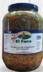
EL FARO PICADILLO VARIANTE Pet 3.850 gr. Cod: 1569