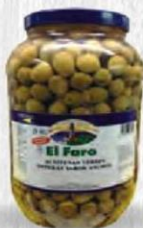
EL FARO ACEITUNAS MANZANILLA Bote 2,5 kg. 160/180 Cod: 2032