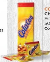
COLA CAO CHOCOLATE Estuche 50 sobres Cod: 311