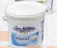
SAN MILLÁN QUESO DE UNTAR CUBO 3 KG. Cod: 2446 El Kilo sale a 5,764€