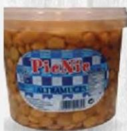
PICNIC ALTRAMUCOS Bolsa 2,5 kg. Escurrido Cod: 1939