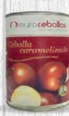
EUROCEBOLLA CEBOLLA CAMELIZADA Bote 400 gr. Cod: 1968