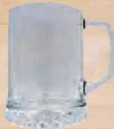
ROYAL GOLD JARRA CERVEZA 62 cl. - P/6 uds. Cod: 2732