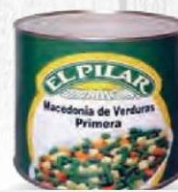
EL PILAR MACEDONIA DE VERDURAS LATA 3 KG. Cod: 2072