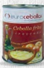
EUROCEBOLLA CEBOLLA FRITA Bote 1/2 kg. Caja de 12 uds Cod: 348