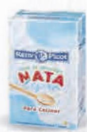
RENY PICOT NATA COCINA 12% M.G. 1 L. CAJA 6 UDS. Cod: 1795