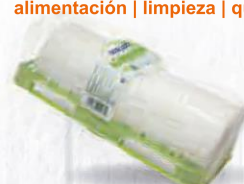
RENY PICOT QUESO DE RULO DE CABRA 100% PIEZA 1 KG. Cod: 2720