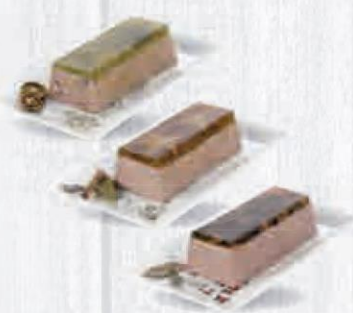
GEMI PATE CAMPAÑAR A LA PIMIENTA Y FINAS HIERBAS 1 KG. APROX. Cod: 2116 (CAMPANAR) Cod: 2017 (PIMIENTA) Cod: 2018 (FINAS HIERBAS)