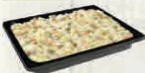
ENSALADILLA RUSA 2 KG. Cod: 1861