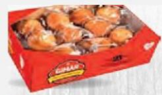
IMAR IAGDALENA CASERA aja 2 kg. Cod: 2639