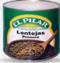
EL PILAR LENTEJAS PRIMERA Lata 3 kg Caja 6 uds Cod: 365