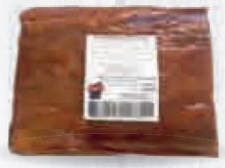
CAMPOFRÍO BACON MITADES CON PIEL PIEZA 2 KG. APRG.APRL Cod: 1934