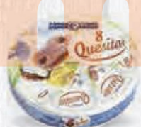
RENY PICOT QUESO FUNDIDO PORCIONES 125 GR. Cod: 2201