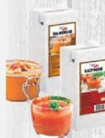
CAMPOFRÍO GAZPACHO O SALMOREJO 1,5 L. Cod: 2765 GAZPACHO Cod: 2766 SALMOREJO