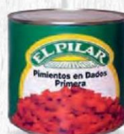
EL PILAR PIMIENTOS EN DADOS 1 CAJA 6 UDS LATA 3 KG. Cod: 361