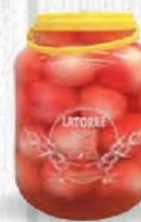
LA TORRE CEBOLLITA BLANCA Bote 2,3 kg. Cod: 2408