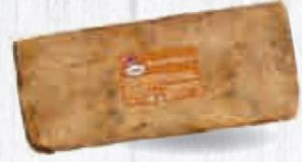
CAMPOFRÍO BACON MOLDE PIEZA 4,2 KG. APROX. Cod: 1007