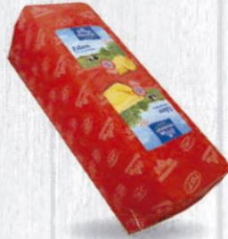
EDAMER QUESO BARRA EDAM 3 KG. APROX. Cod: 1279