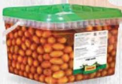
ZAMBUDIO ACEITUNAS MOJO PICÓN CON HUESO Bote 4,5 kg. Cod: 642