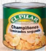
EL PILAR CHAMPIÑÓN LAMINADO CAJA 6 UDS. LATA 3 KG. Cod: 363