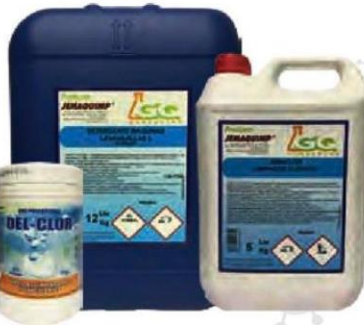
JEMA CLOR LIMPIADOR CLORADO 5 Kg Cod: 2751