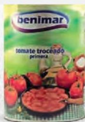
BENIMAR TOMATE TROCEADO LATA 4,2 KG. Cod: 2569