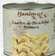
BENIMAR ALCACHOFA CUARTOS LATA 3 KG. Cod: 1618