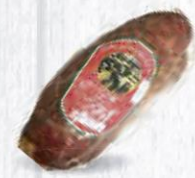
SOBRASADA JABUGO C.B. AL VACÍO PIEZA 1,5 KG. APROX. Cod: 2731