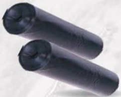
BOLSA DE BASURA 85 x 105 caja 30 rollos x 10 uds Baja densidad cod: 1973