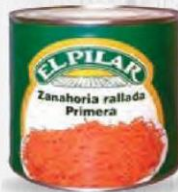
EL PILAR ZANAHORIA RALLADA LATA 2,5 KG. CAJA 6 UDS. Cod: 2558