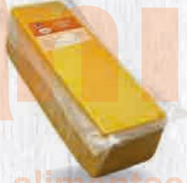
CAMPOFRÍO QUESO BARRA CHEDDAR ROJO 3 KG. APROX. Cod: 2458