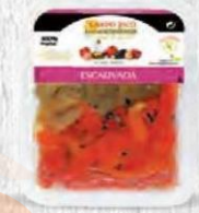
CAMPO RICO ESCALIVADA Bandeja 500 gr. Cod: 1993