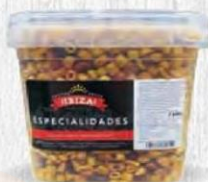
FRUTOS SECOS IBIZA COCKTAIL BARBAOCO Cubo 1,6 kg. Cod: 2183