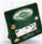
SOCIÉTÉ QUESO ROQUEFOR1 CUÑA 100 GR. C/10 UDS. Cod: 2825