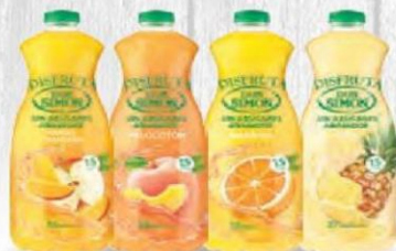
DON SIMÓN NÉCTAR SIN AZÚCAR DISFRUTA 1,5 L. 6 bot. MANGO-MANZANA Cod: 1690 NARANJA Cod: 1378 MELOCOTÓN Cod: 1380 PIÑA Cod: 1379