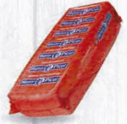
RENY PICOT QUESO BARRA ROJA EDAM 3 KG. APROX. Cod: 1857