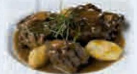
RABO DE TORO 400 GR. Cod: 2493