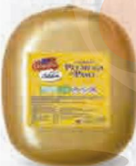
CAMPOFRÍO PECHUGA DE PAVO FS 5,5 KG. APROX. Cod: 2587