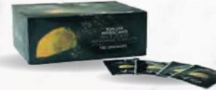
TOALLITA MANOS (Marisco) Caja 500 uds. Cod: 2165