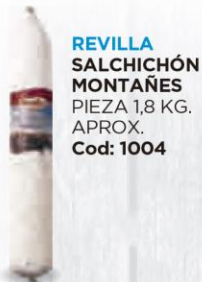
REVILLA SALCHICHÓN MONTAÑES PIEZA 1,8 KG. APROX. Cod: 1004