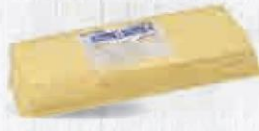
RENY PICOT QUESO FUNDIDO LONCHAS 1584 GR. APROX. Cod: 1787