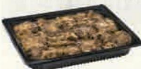
RABO ESTOFADO 2,2 KG. Cod: 2670