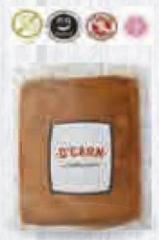
D'CARN BACON MEDIA PIEZA 2 KG. APROX. Cod: 2708