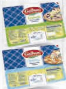
GALBANI MOZZARELLA CUBETTI 2,5 KG. C/4 UDS. Cod: 2823