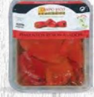
CAMPO RICO PIMIENTOS ROJOS ASADOS ENTEROS Bandeja 500 g Cod: 1906