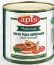
APIS SALSA PIZZA ESPECIAL Bote 2,5 kg. Cod: 2729