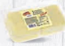
CAMPOFRÍO QUESO SANDWICH LONCHAS PARA FUNDIR BANDEJA 1 KG. (48 LONCHAS) Cod: 1026