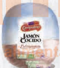
CAMPOFRÍO JAMÓN COCIDO EXTRAJUGOSO 6 KG. APROX. Cod: 1791