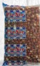
PICNIC CACAHUETE MONDADO PIEL CRUDO Bolsa 1 kg. Cod: 1941