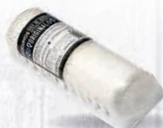
FORVAL QUESO RULO COMBI PIEZA 1 KG. Cod: 1247