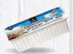
FLOR DE BURGOS QUESO FRESCO BRICK 1 KG. Cod: 1438