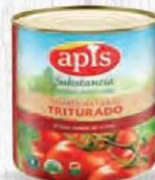
APIS TOMATE TRITURADO LATA 2,5 KG. Cod: 2730