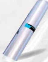
ROLLO PAPEL FILM 30 x 250 Cod: 530